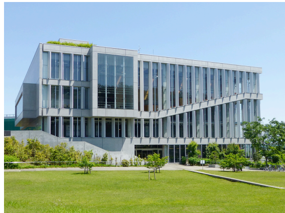
会場「早稲田リサーチパーク・コミュニケーションセンター」

協力先企業の新規開拓・情報収集等を目的とした商談会を開催致します。将来的な取引や連携を見据え、埼玉県北部地域の魅力ある企業との出会いを通じた情報交換・新規商談のきっかけづくりにお役立ていただけますので是非この機会をご活用ください。